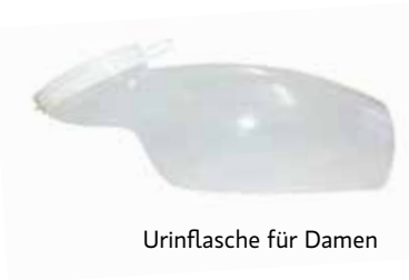
Urinflasche für Damen

Bei bettlägerigen Patienten kommen Urinflaschen beziehungsweise Urinauffangtöpfe und Steckbecken zum Einsatz.