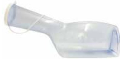
Urinflasche für Herren